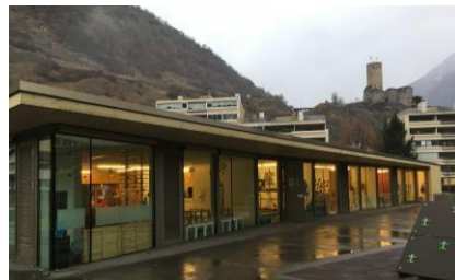
UAPE « Le Totem » en Ville