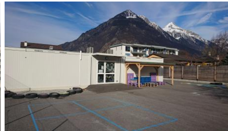
UAPE « Au beau milieu » au Chemin du Milieu