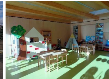
UAPE « La Charade » à Charrat