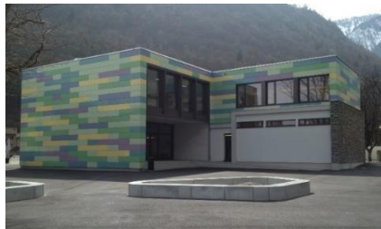
UAPE « L'Abricojeux » à Martigny Bourg

Plus d'informations : 027 721 26 87 ou coordination@ape-martigny.ch